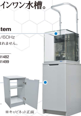
※キャビネット正面

キャビネット ¥18,000(税抜価格) JAN / 4971664531529