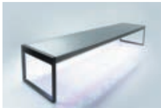
アジャスタースタンド