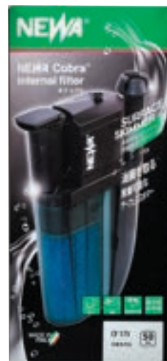
■ネワ コブラ CF 175 オープン価格 50Hz:JAN/8017003091654 60Hz:JAN/8017003091692