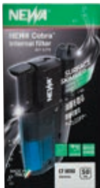
■ネワ コブラ CF Mini オープン価格 50Hz:JAN/8017003091623 60Hz:JAN/8017003091661