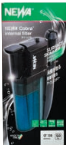
■ネワ コブラ CF 130 オープン価格 50Hz:JAN/8017003091647 60Hz:JAN/8017003091685