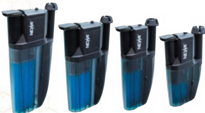
ネワ コブラ CF 175