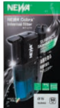
■ネワ コブラ CF 75 オープン価格 50Hz:JAN/8017003091630 60Hz:JAN/8017003091678