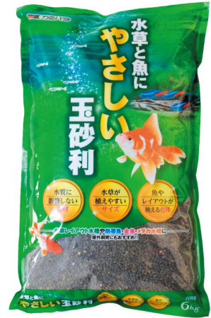
6kg ¥2,000 (税抜価格) JAN / 4971664433519