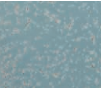
みじんこ増殖エキス未使用時のミジンコ。