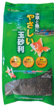
2kg ¥800 (税抜価格) JAN / 4971664433502