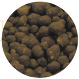
● 茶ソイル 5ℓ ¥2,000 (税抜価格) JAN / 4971664433403