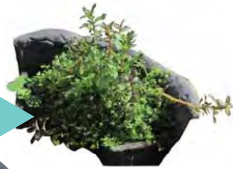
プランツアイランド