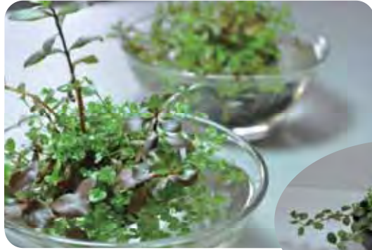
テーブルプランツ