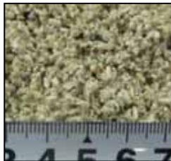
粒サイズの目安 約1.0～2.0mm