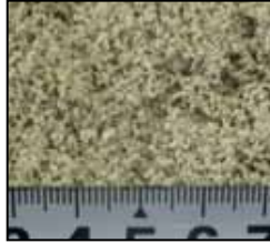
粒サイズの目安 約0.1～1.0mm