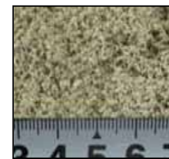
粒サイズの目安 約0.5～1.0mm