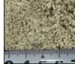
粒サイズの目安 約0.5～1.5mm