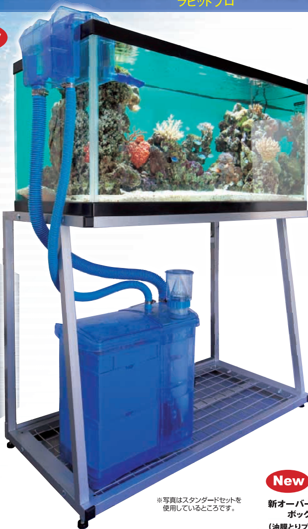
*写真はスタンダードセットを使用しているところです。

海水魚飼育用の新しいフィルターシステムです。オーバーフローボックスとフィルタータンクから成り、60cmまたは90cm水槽でオーバーフローシステムを再現することができます。