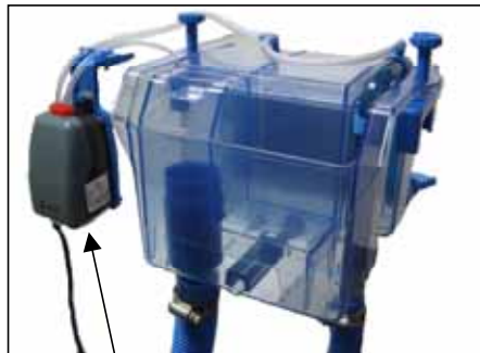
バキュームポンプ