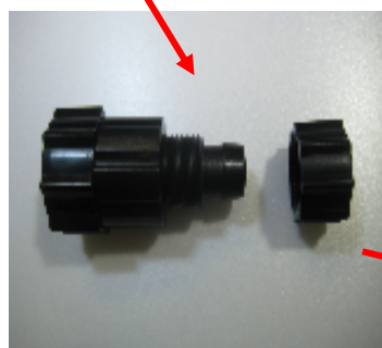
ターボツイスト Z 18W 本体