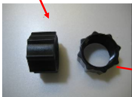
ターボツイスト Z 9W 本体