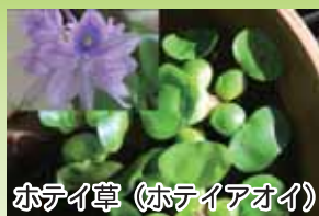
ホテイ草 (ホテイアオイ)