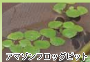
アマゾンフロッグピット