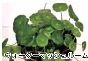
ウォーターマッシュルーム