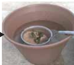
③ゆっくり水を入れる