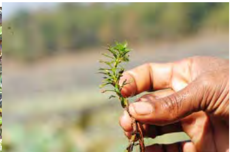
インディアンミリオフィラム “シモガ A” カルナータカ州 シモガ県 (Shimoga (Shivamogga) district)