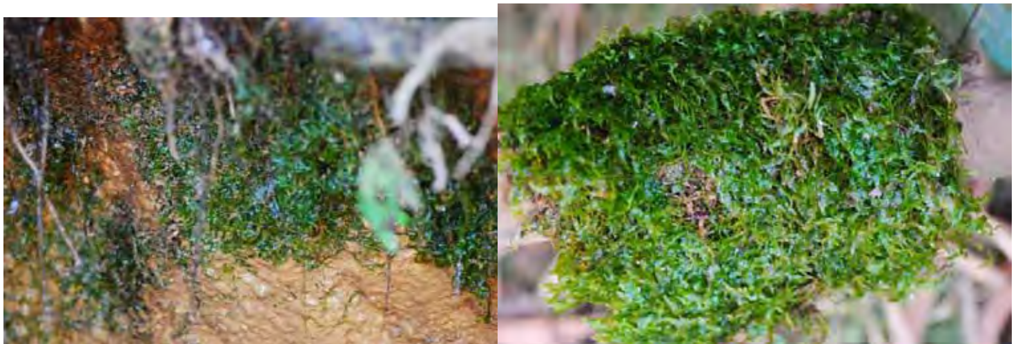
ホソバミズゼニゴケ SP “シモガ” カルナータカ州 シモガ県 (Shimoga (Shivamogga) district)