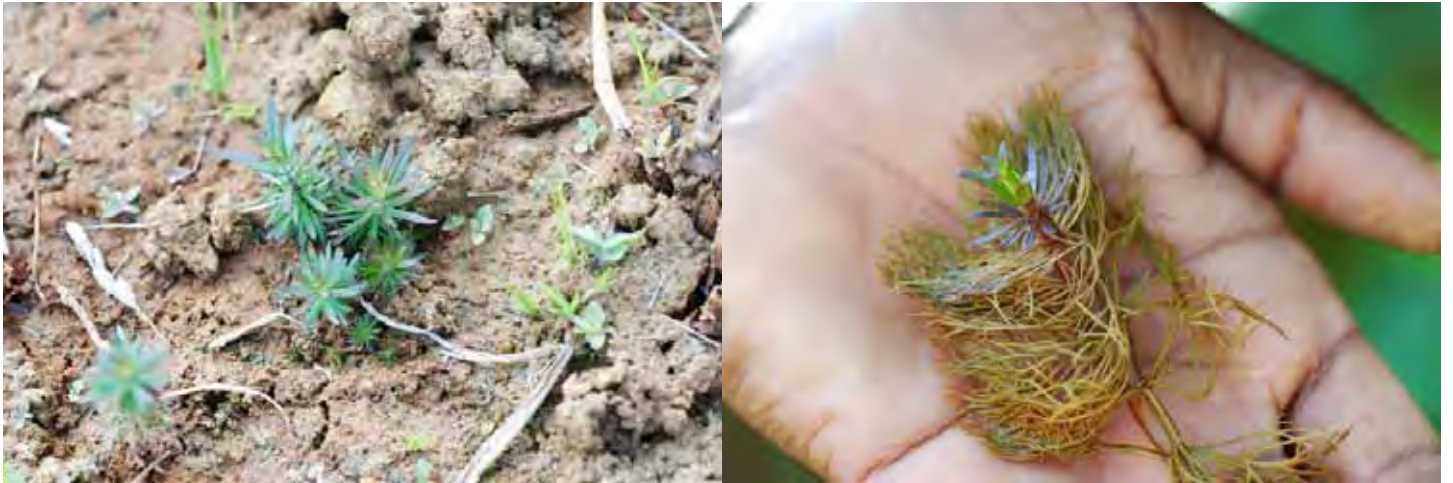
リムノフィラ SP “シモガ A” カルナータカ州 シモガ県 (Shimoga (Shivamogga) district)