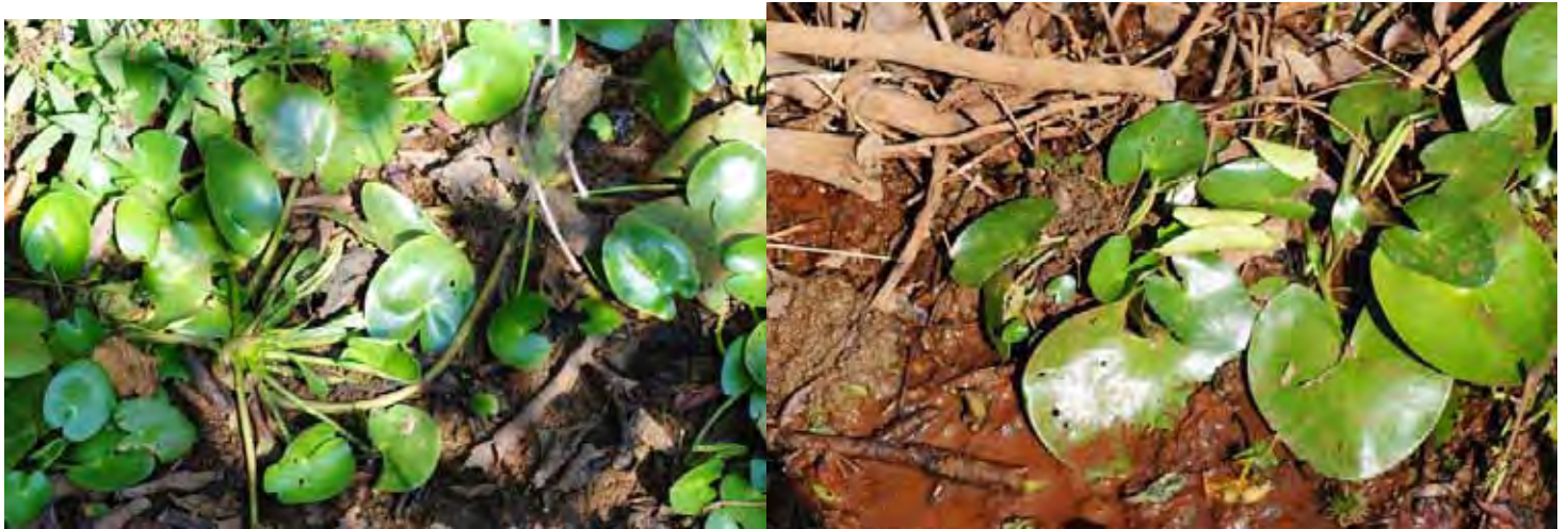
ニムフォイデスSP “シモガ” カルナータカ州 シモガ県(Shimoga (Shivamogga) district)