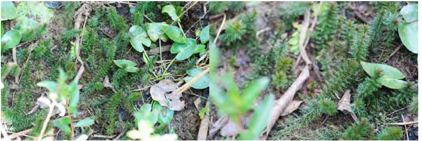
インディアンミリオフィラム “シモガ B” カルナータカ州 シモガ県(Shimoga (Shivamogga) district)