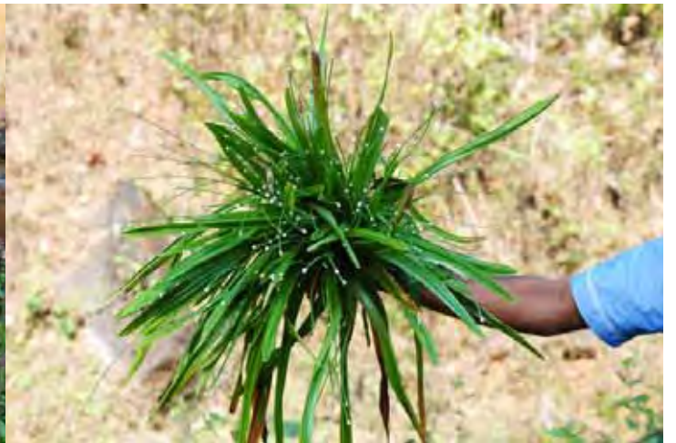
ホシクサSP “ロブスト” カルナータカ州 シモガ県(Shimoga (Shivamogga) district)