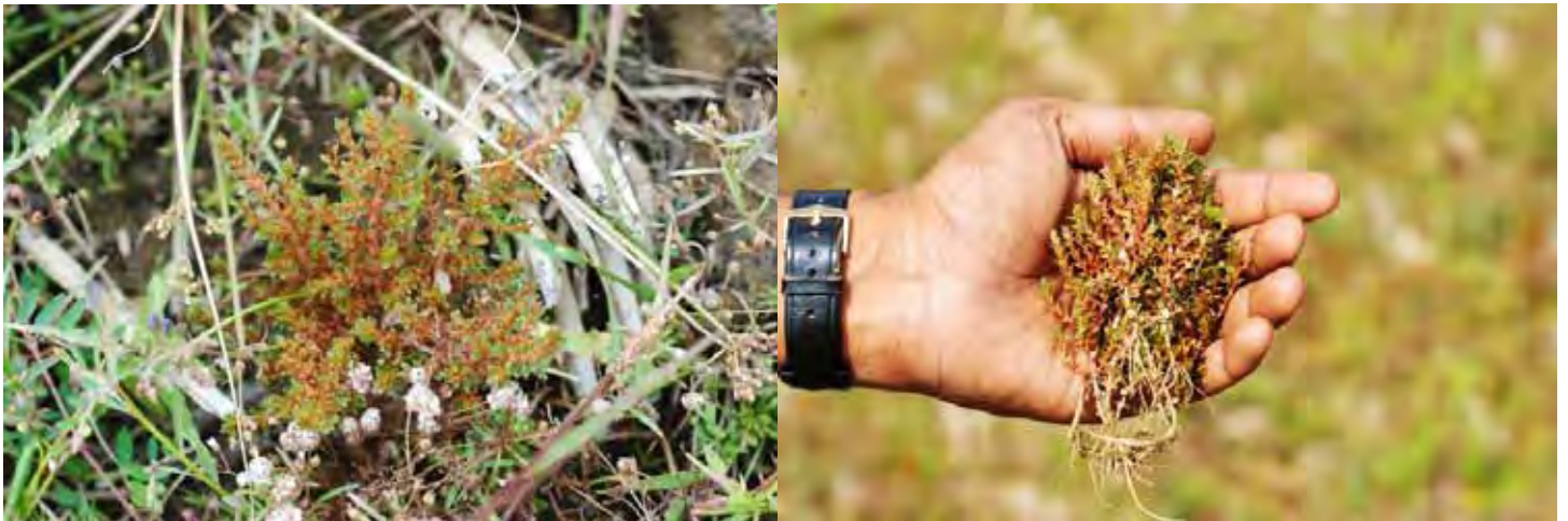
ロタラSP “ウッタラ・カンナダ” カルナータカ州 ウッタラ・カンナダ県 (Uttar(a) Kannad(a) district)