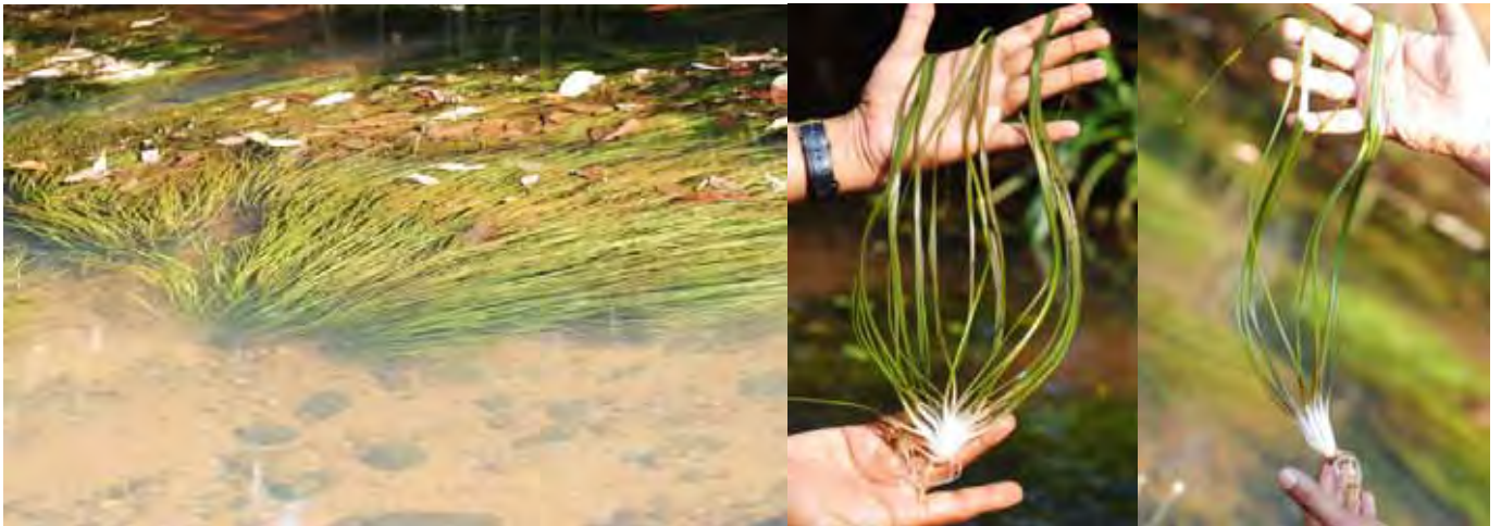
クリプトコリネSP “ウッタラ・カンナダ” カルナータカ州 ウッタラ・カンナダ県 (Uttar(a) Kannad(a) district)

カルナータカ州 ダクシナ・カンナダ県 (Dakshin(a) Kannad(a) district)