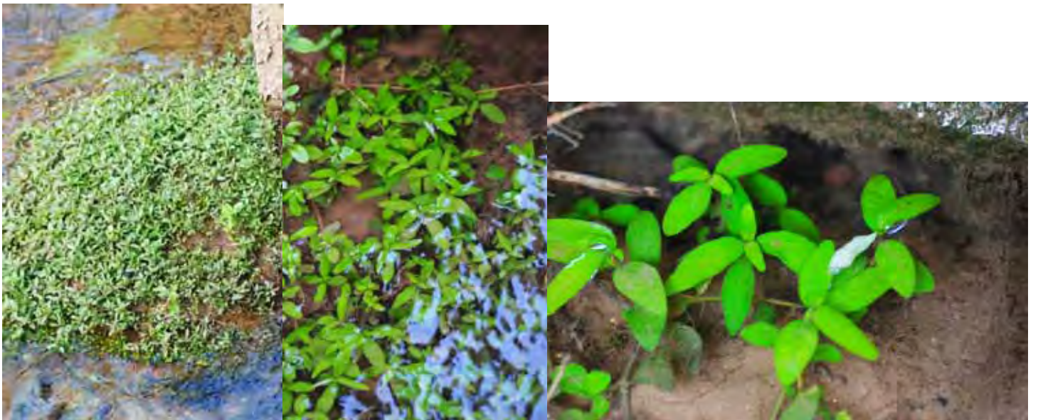
ハイグロフィラ ポリスペルマ “イェルナークラム” ケーララ州 イェルナークラム県 (Ernakulam district)

カルナータカ州 ウッタラ・カンナダ県 (Uttar(a) Kannad(a) district)