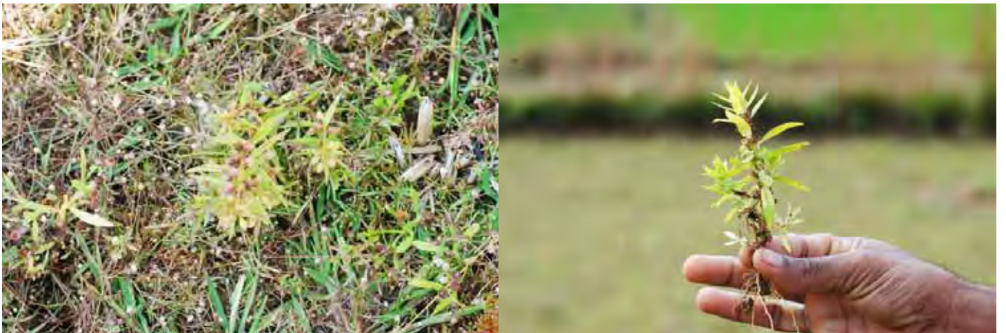
アマニアSP “ウッタラ・カンナダ” カルナータカ州 ウッタラ・カンナダ県 (Uttar(a) Kannad(a) district)