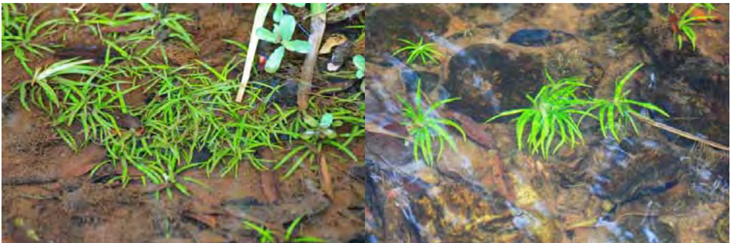
ホシクサSP“ウィロー” カルナータカ州 ダクシナ・カンナダ県(Dakshin(a) Kannad(a) district)

* 第2、4、8弾でも入荷したホシクサSP "MALAYATOOR"も同時再入荷します