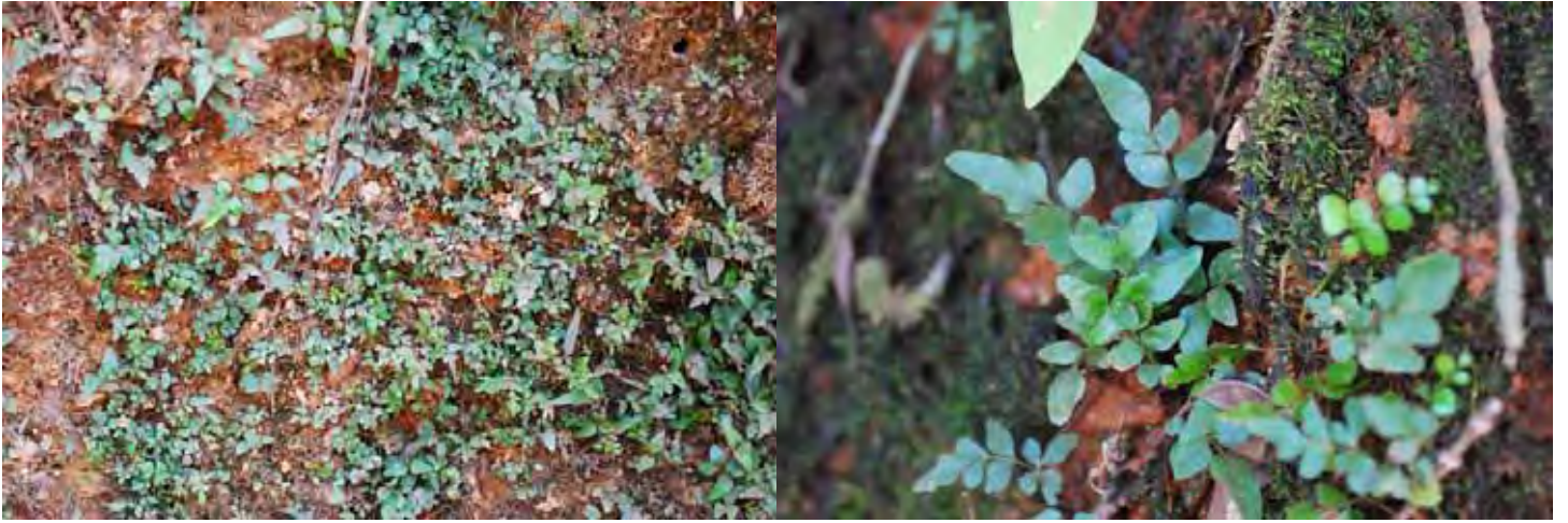
プテリス SP “シモガ” カルナータカ州 シモガ県 (Shimoga (Shivamogga) district)