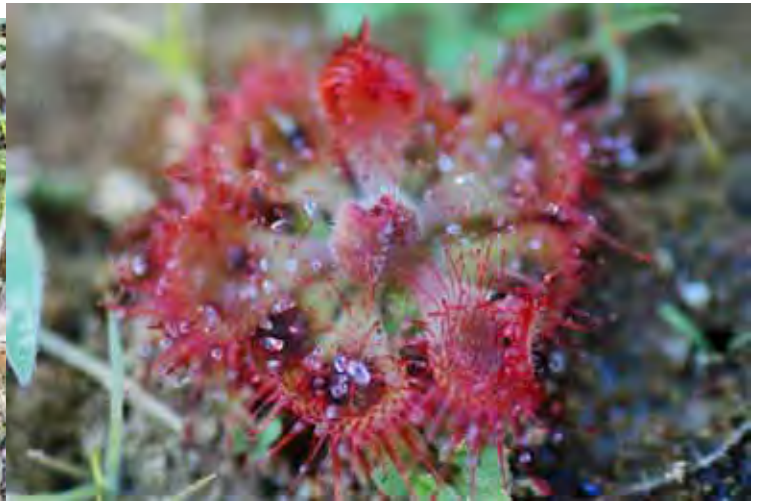
モウセンゴケ S P “シモガ” カルナータカ州 シモガ県 (Shimoga (Shivamogga) district)