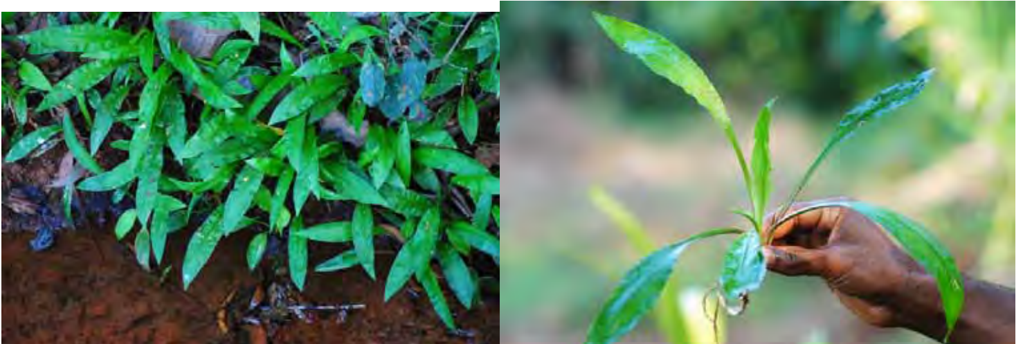
クリプトコリネSP “シモガ” カルナータカ州 シモガ県 (Shimoga (Shivamogga) district)