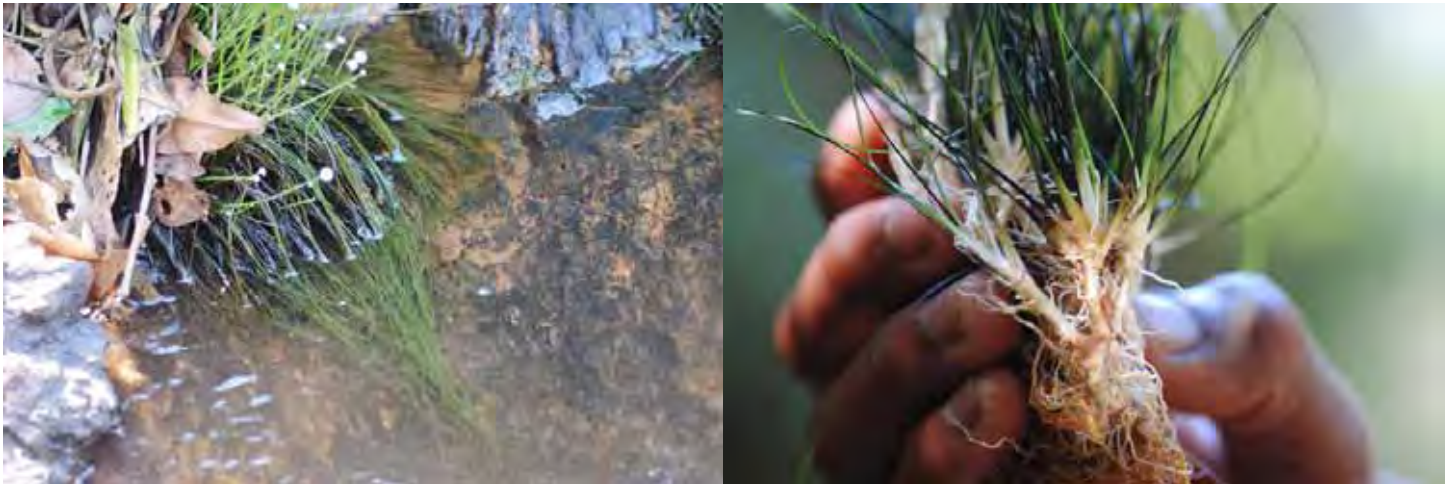
ホシクサSP“ソーシャルフェザーダスター”

カルナータカ州 ウッタラ・カンナダ県(Uttar(a) Kannad(a) district)