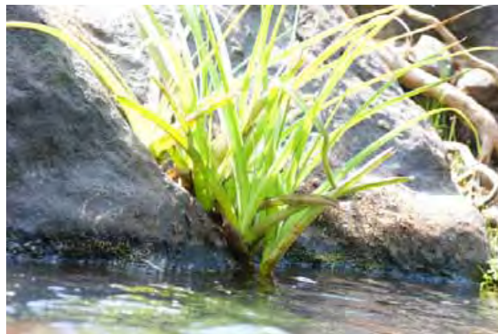
クリヌムSP “ダクシナ・カンナダ” カルナータカ州 ダクシナ・カンナダ県(Dakshin(a) Kannad(a) district)