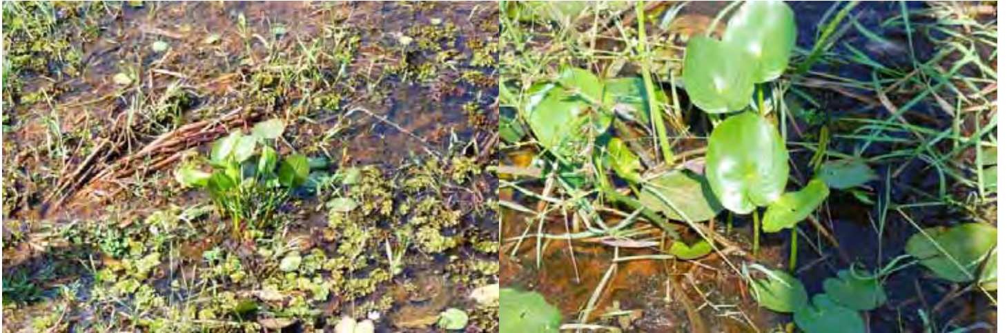
マルバオモダカ “シモガ” カルナータカ州 シモガ県 (Shimoga (Shivamogga) district)