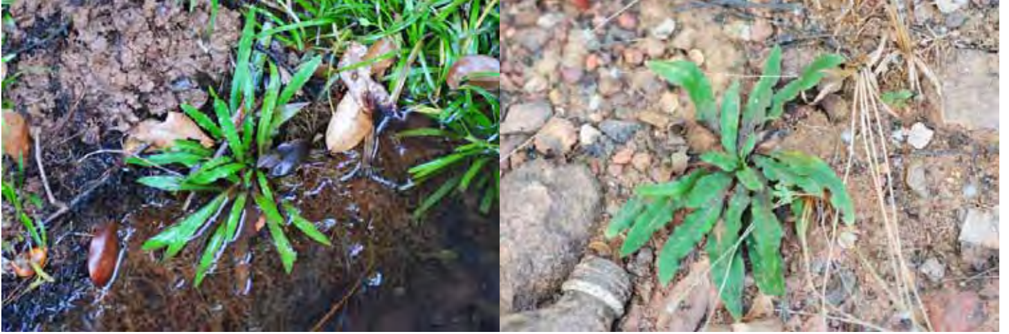
クリプトコリネSP “ダクシナ・カンナダ”

カルナータカ州 ダクシナ・カンナダ県 (Dakshin(a) Kannad(a) district)