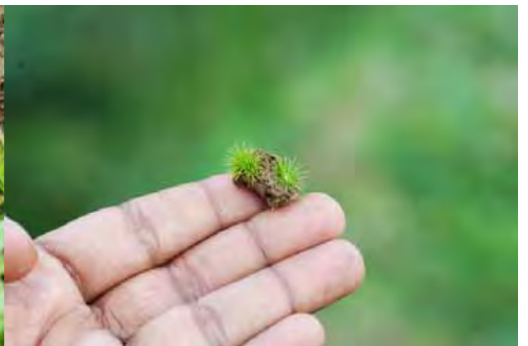
ホシクサSP “インディアンキネレウム” カルナータカ州 ウッタラ・カンナダ県(Uttar(a) Kannad(a) district)