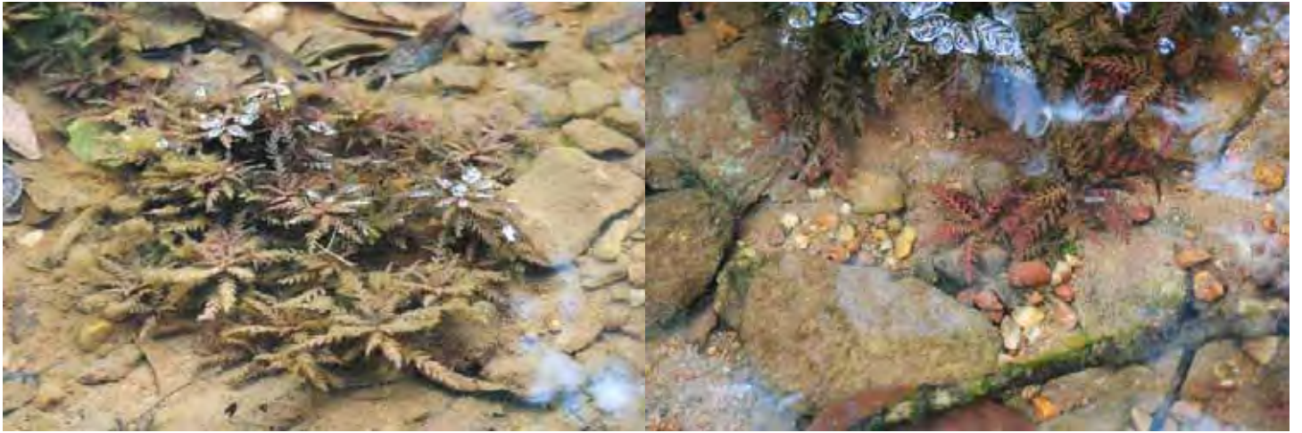
ハイグロフィラ ピナティフィダ “ウッタラ・カンナダ”

カルナータカ州 ウッタラ・カンナダ県 (Uttar(a) Kannad(a) district)