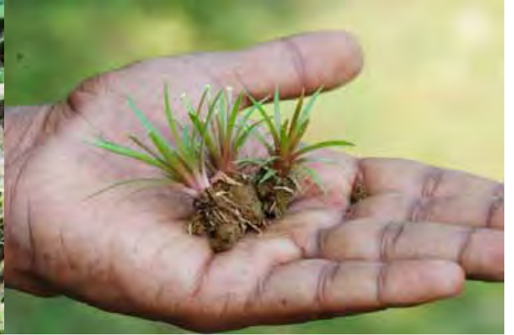
ホシクサSP “キングクリムゾン” カルナータカ州 シモガ県(Shimoga (Shivamogga) district)